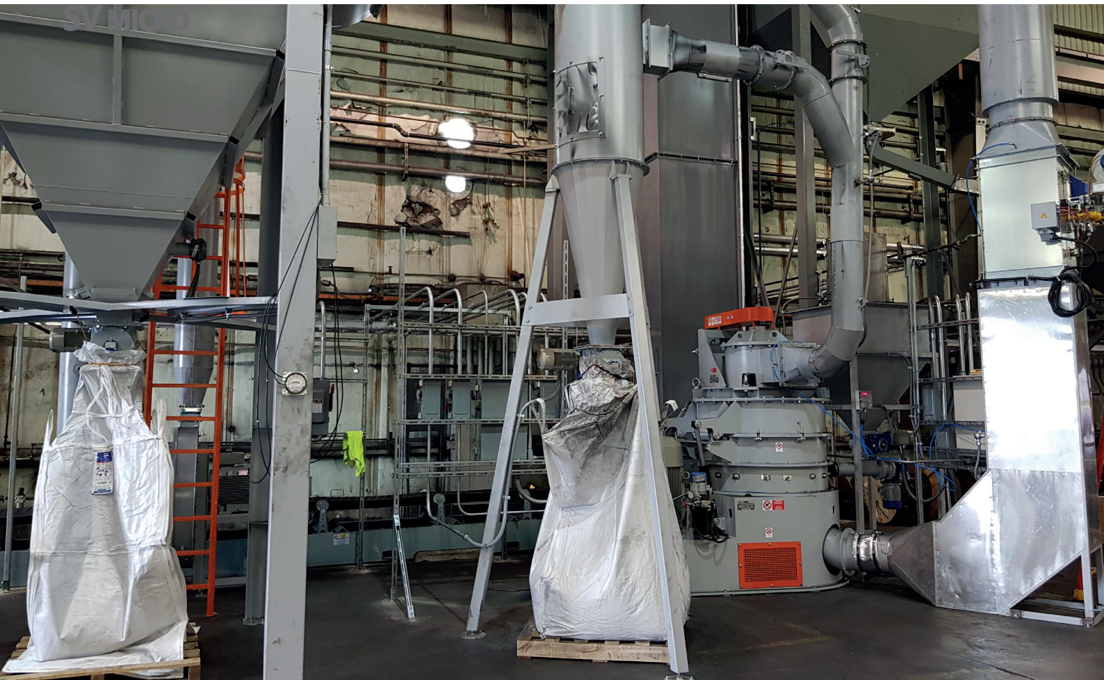
SV4 Micro graphite powder production plant