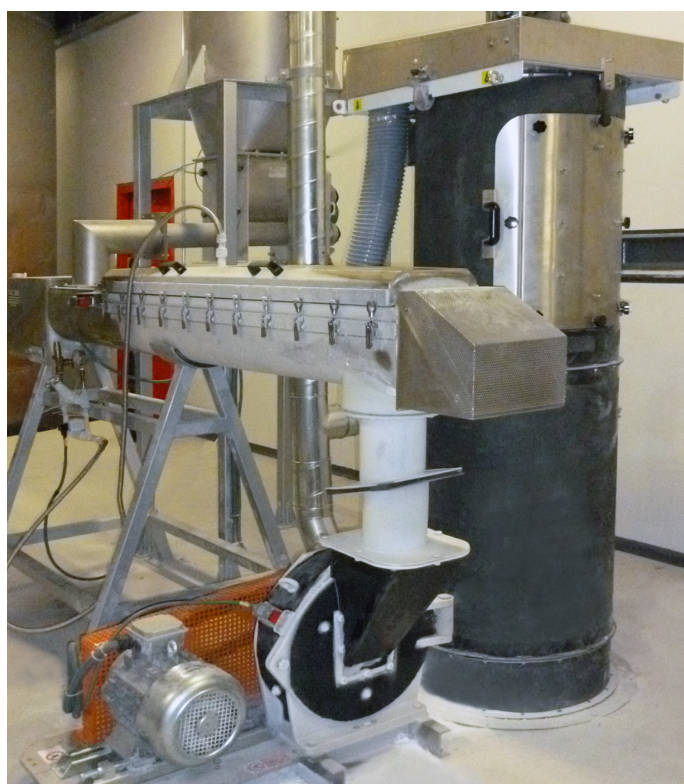
Impianto automatico con polverizzatore "x" e sistema criogenico per materiali termosensibili. Automatic plant with mill "x" and cryogenic system suitable for thermosensitive products.