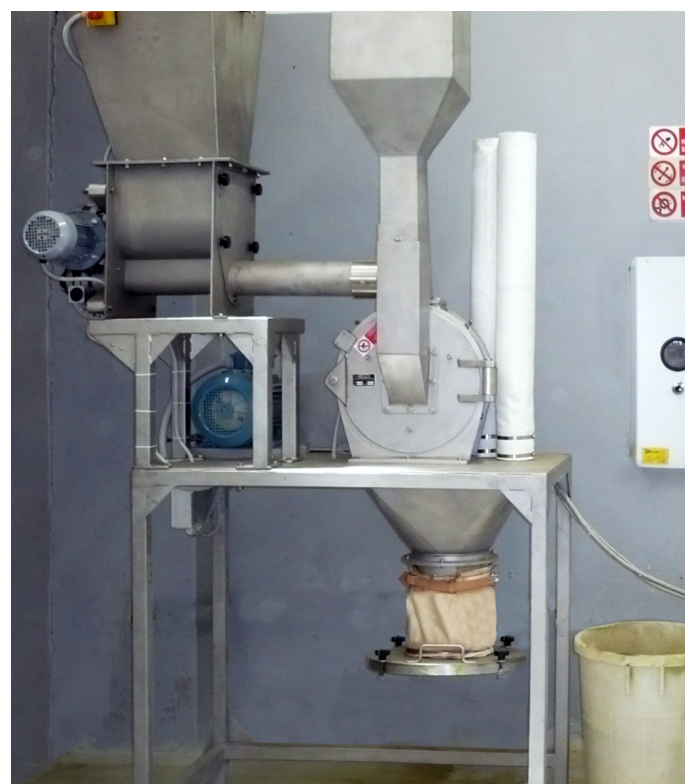
Polverizzatore serie "x" con microdosatore. Mill type "x" with micro feeder.