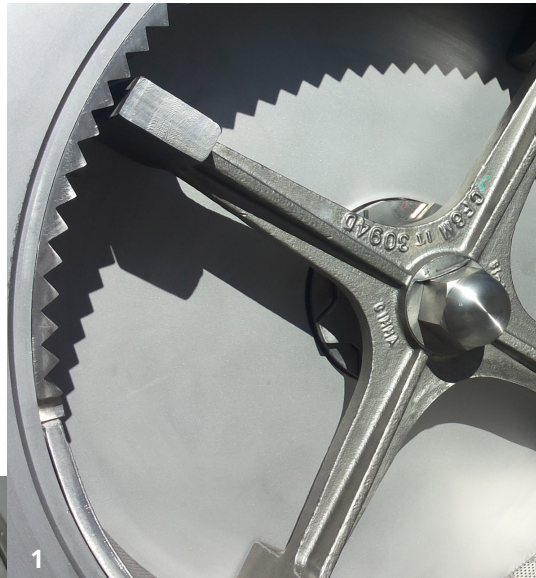
1 - Rotore tipo P Rotor type P

Particolare della camera di macinazione Detail of the grinding chamber