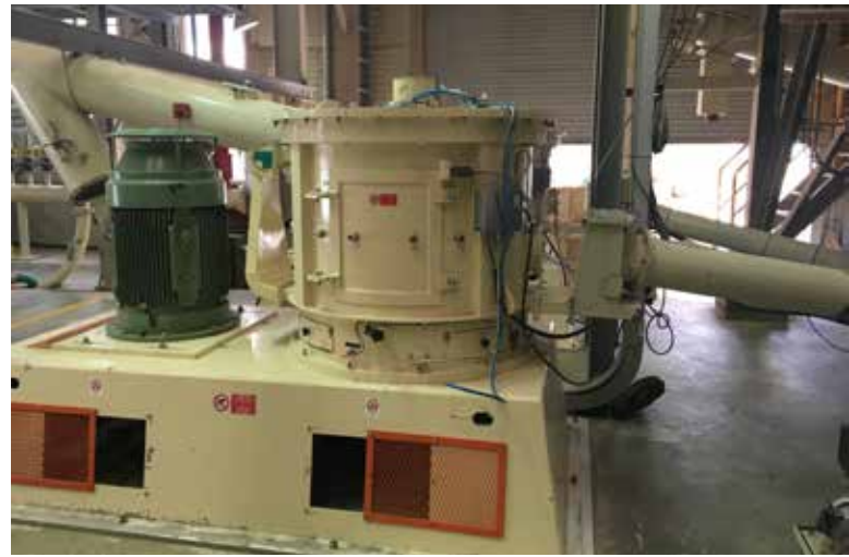
Plastic grinding system SF 100

A seconda della tipologia dei materiali da macinare, è possibile predisporre l'impianto con sistemi di raffreddamento, essiccazione, gas inerte a circuito chiuso.