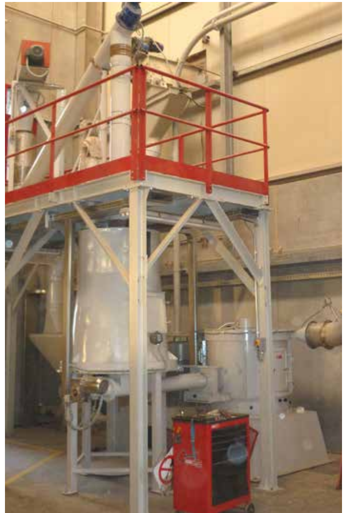
Wood Flour production plant SF100