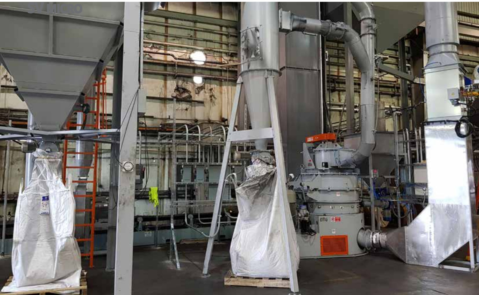
SV4 Micro graphite powder production plant