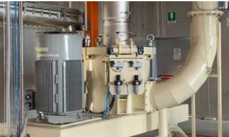
Grinding plant of chemicals with PPS-1000 TX