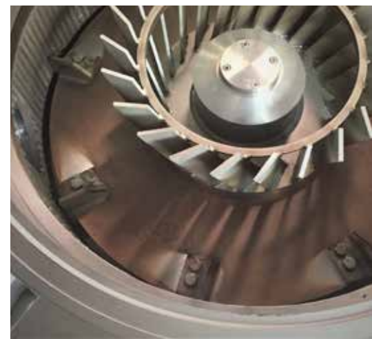
Detail of the grinding room