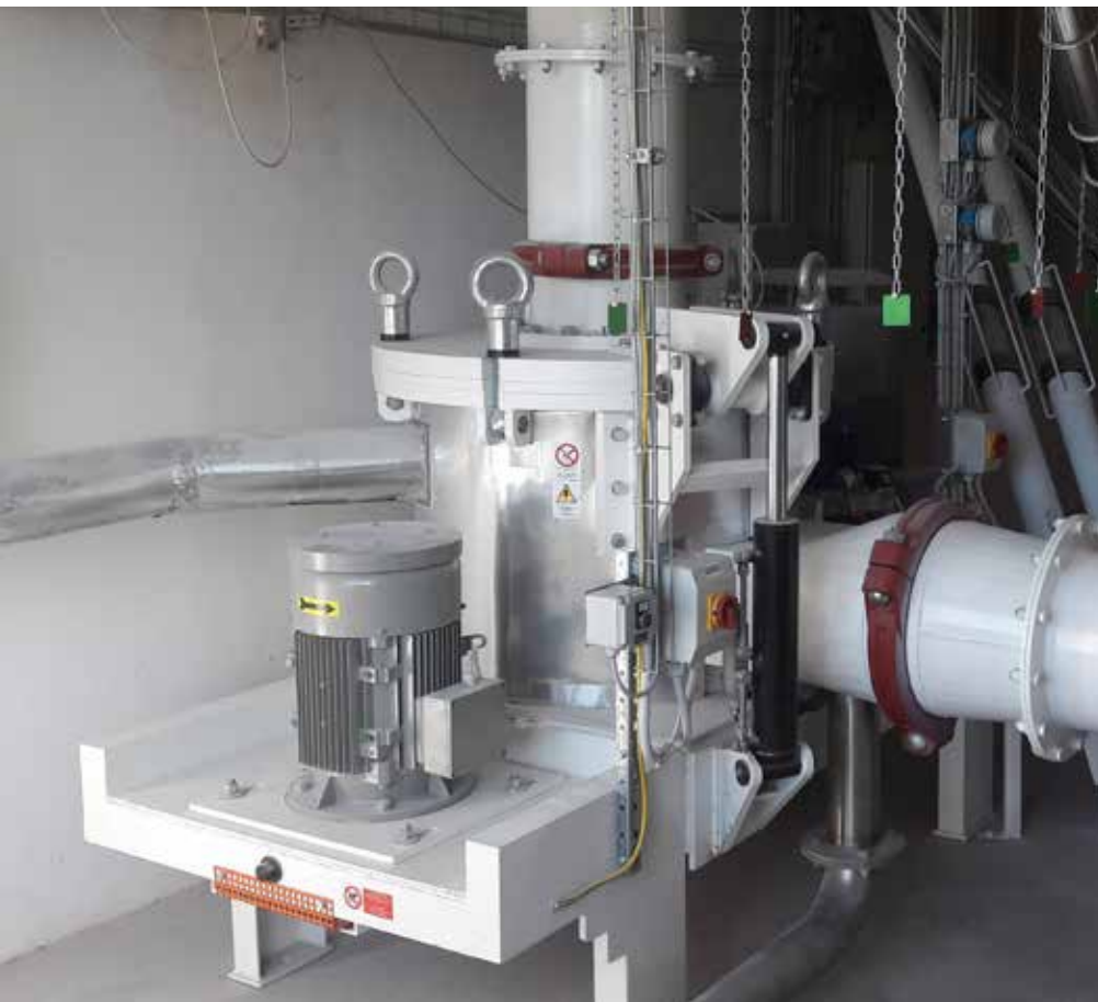
Cereal flour plant PPS-750 TX